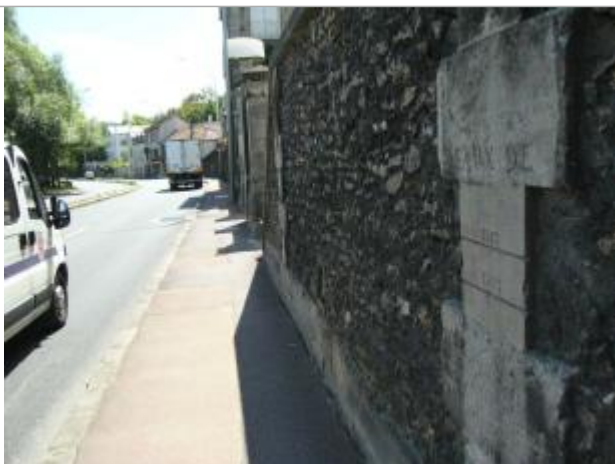
Repères de crue de 1910, 1778 et 1783

Système altimétrique : NGF IGN 1969 (système normal)