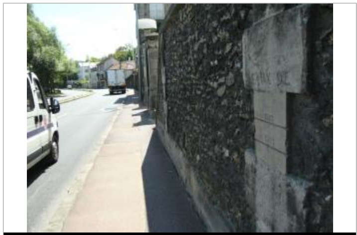
Repères de crue de 1910, 1778 et 1783

GÉNÉRAL Code : DIREN_IDF_R_117_178 Date de mise à jour : 31/05/2018 Auteur : SPC SMYL