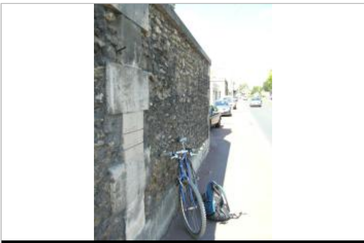
10 quai Rennequin-Sualem - auteur photo : DIREN IDF

GÉOLOCALISATION Coordonnées WGS84 : X: 2.12529120 / Y: 48.87058650 Coordonnées RGF93 (Lambert 93) X: 635837.88 / Y: 6863750.91 Coordonnées RGF93 (ETRS89) : X: 2.1252912 / Y: 48.8705865 Code Hydro: ----0010 Rive de référence: Gauche