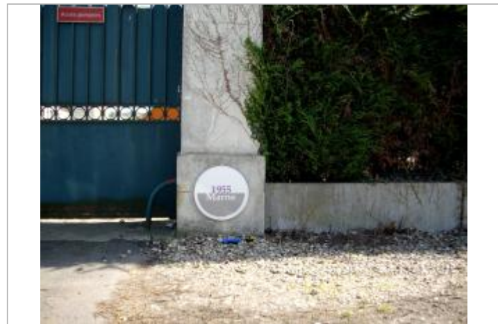
Repère de crue de 1955