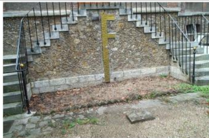
Capture photo fiche IGN Géodésie K.D.N3 - 26

Coordonnées WGS84 : X: 2.04524870 / Y: 48.95083100