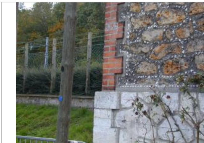
Maison éclusière au barrage d'Evry-sur-Seine