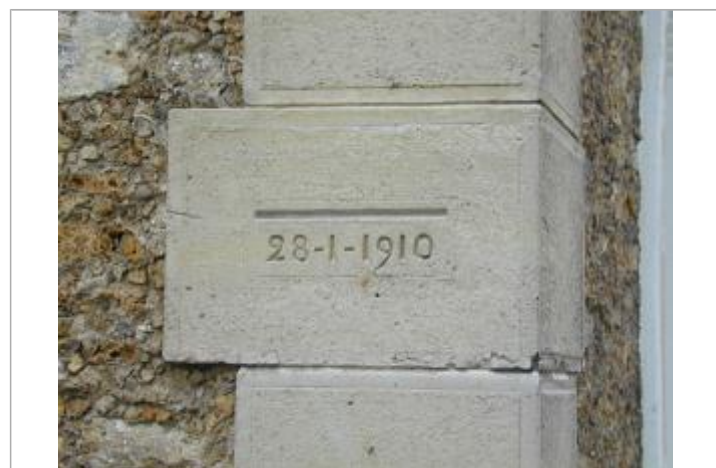
Repère de crue de 1910