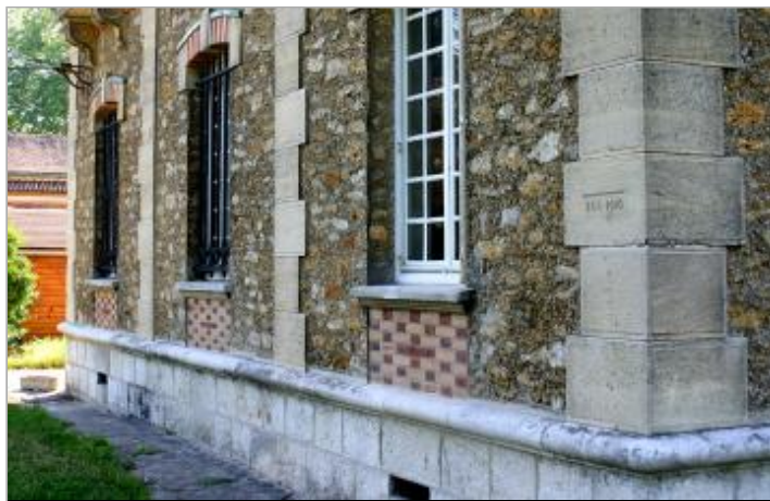
Château de Port Courcel, face opposée Seine