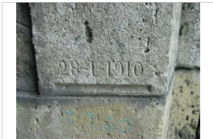
Repère de crue de 1910

Méthode : Non renseigné Organisme : DIREN Île-de-France Référence nivelée : Marque d'inondation Système altimétrique : NGF IGN 1969 (système normal)