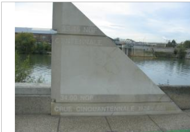
Monument en pierre avec les repères de crue