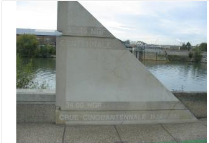
Monument en pierre avec les repères de crue

Coordonnées WGS84 : X: 2.41019342 / Y: 48.81007780