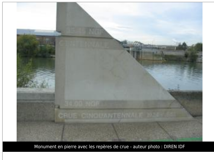
Monument en pierre avec les repères de crue