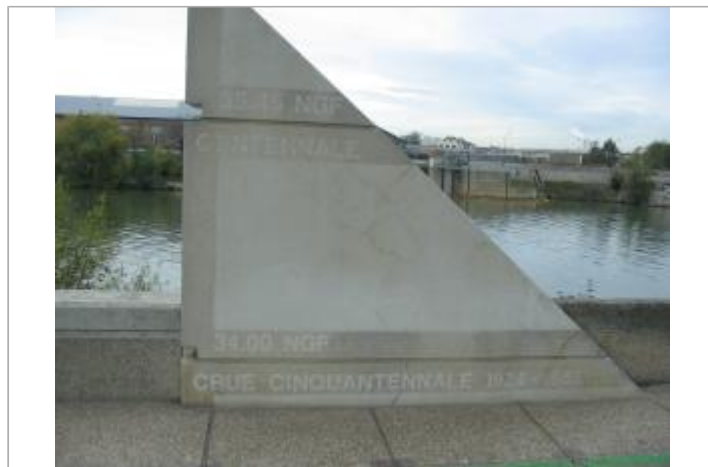
Monument en pierre avec les repères de crue

GÉOLOCALISATION Coordonnées WGS84 : X: 2.41019342 / Y: 48.81007780 Coordonnées RGF93 (Lambert 93) X: 656685.45 / Y: 6856829.13 Coordonnées RGF93 (ETRS89) : X: 2.4101934 / Y: 48.8100778 Code Hydro: ----0010 Rive de référence: Droite