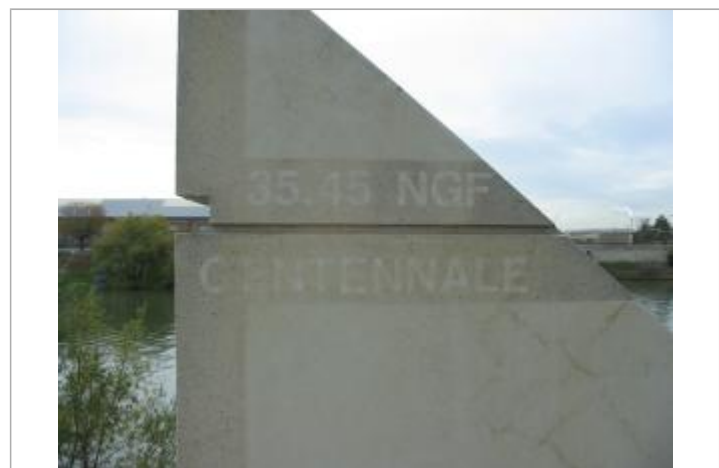
Repère de crue de 1910

GÉNÉRAL Code : DIREN_IDF_R_69_105 Date de mise à jour : 31/05/2018 Auteur : SPC SMYL