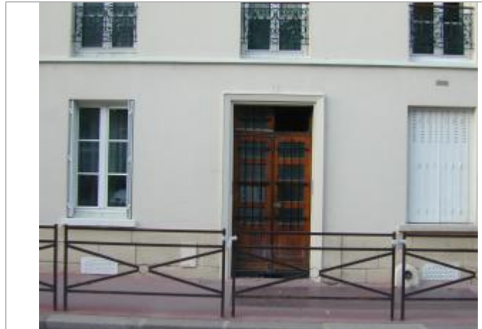
51 avenue du Maréchal Leclerc

Coordonnées WGS84 : X: 2.42611398 / Y: 48.81816460