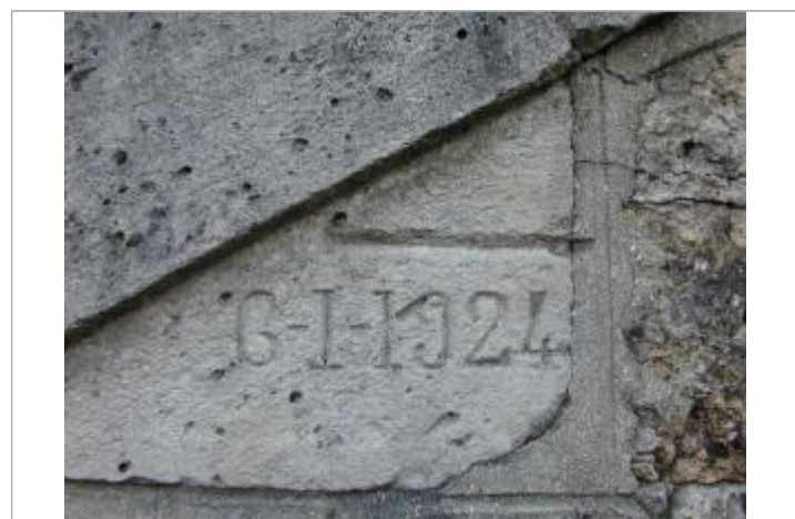
Repère de crue de 1924

GÉNÉRAL Code : DIREN_IDF_R_61_95 Date de mise à jour : 04/05/2026 Auteur : SPC SMYL