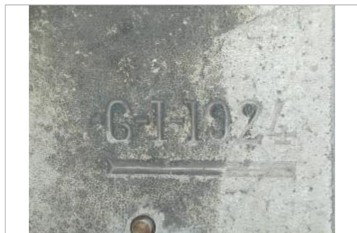
Repère de crue de 1924

GÉNÉRAL Code : DIREN_IDF_R_59_91 Date de mise à jour : 04/05/2026 Auteur : SPC SMYL