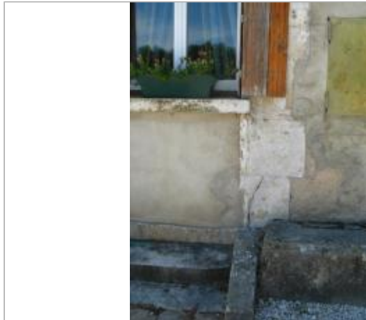
Maison éclusière de Belombre, n°76

Coordonnées WGS84 : X: 3.60182028 / Y: 47.73139360