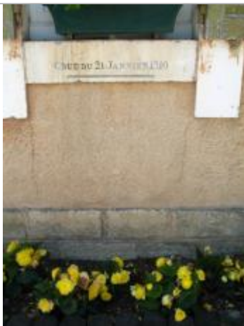
Repère de crue de 1910

Altitude calculée de l'eau (en m) : 105.78 m