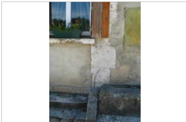
Maison éclusière de Belombre, n°76 - auteur photo : DIREN IDF