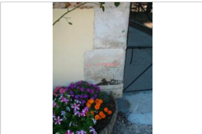
Maison éclusière de Vaux, n°78

GÉOLOCALISATION Coordonnées WGS84 : X: 3.59489270 / Y: 47.75971200 Coordonnées RGF93 (Lambert 93) X: 744567.58 / Y: 6740092.2 Coordonnées RGF93 (ETRS89) : X: 3.5948927 / Y: 47.759712 Code Hydro: F3--0200 Rive de référence: