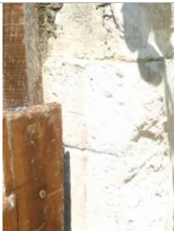
Repère de crue mai 1835

Système altimétrique : NGF IGN 1969 (système normal)