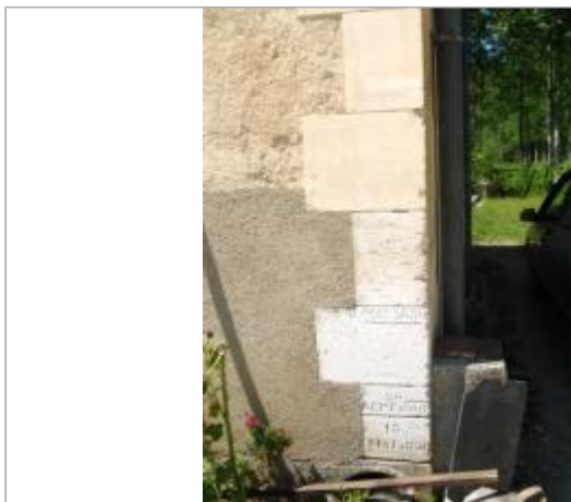
Maison éclusière d'Augy

Coordonnées WGS84 : X: 3.60978560 / Y: 47.77439200