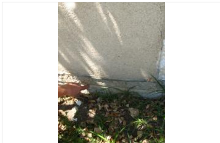
Repère de crue mars 1851

Système altimétrique : NGF IGN 1969 (système normal)