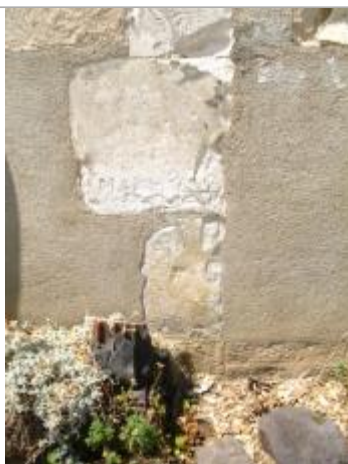
Repère de crue mai 1856

Système altimétrique : NGF IGN 1969 (système normal)