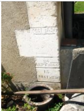
Repère de crue septembre 1866

Altitude calculée de l'eau (en m) : 101.144 m