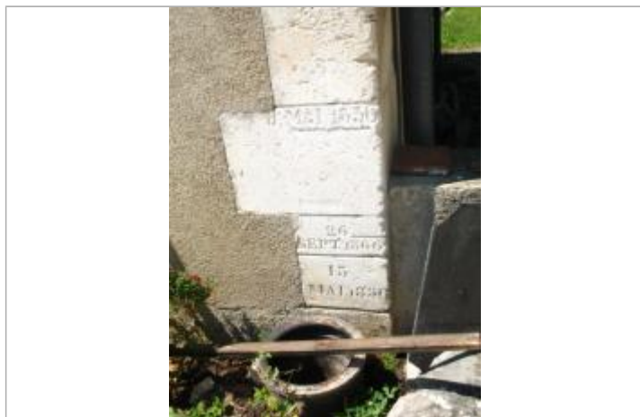
Repère de crue septembre 1866