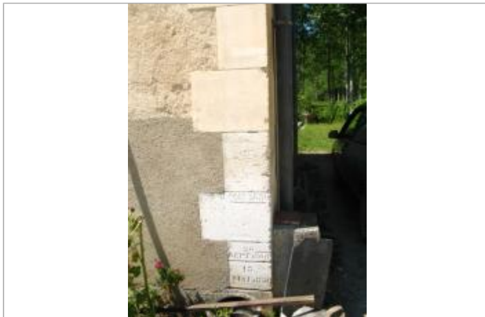
Maison éclusière d'Augy