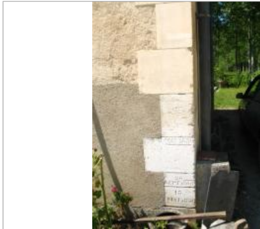
Maison éclusière d'Augy

Coordonnées WGS84 : X: 3.60978560 / Y: 47.77439200