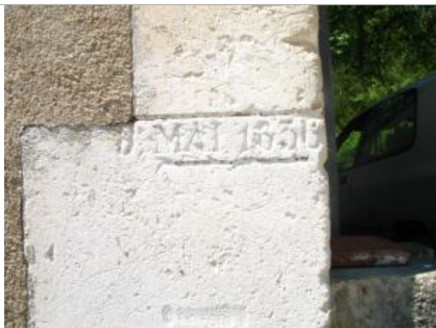
Repère de crue mai 1836

Système altimétrique : NGF IGN 1969 (système normal)