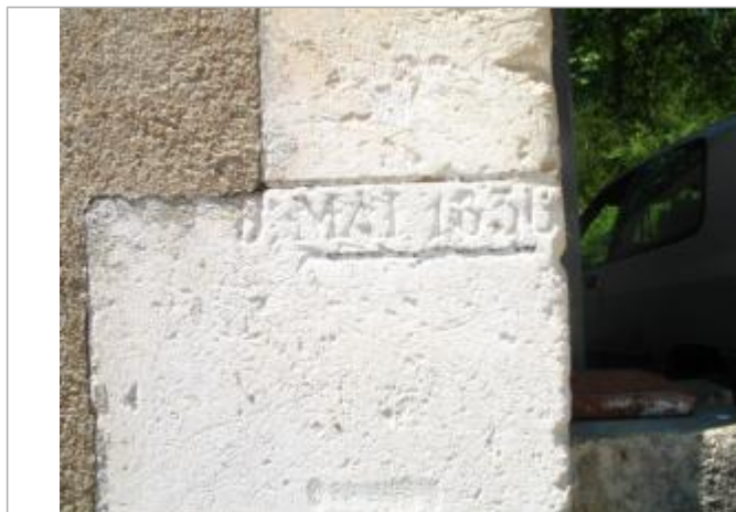
Repère de crue mai 1836