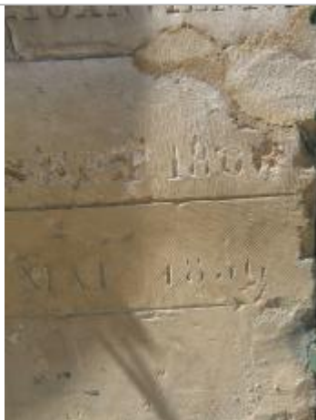
Repère de crue de 1856 et 1866

Altitude calculée de l'eau (en m) : 100.089 m