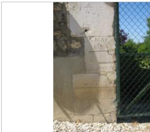
Maison éclusière de Preuilly

Coordonnées WGS84 : X: 3.59349600 / Y: 47.78518300