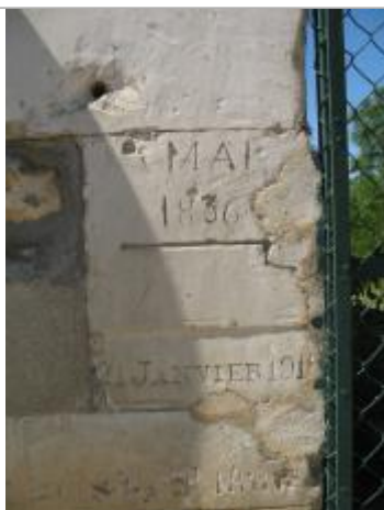
Repère de crue de 1910 et 1836

Altitude calculée de l'eau (en m) : 100.381 m