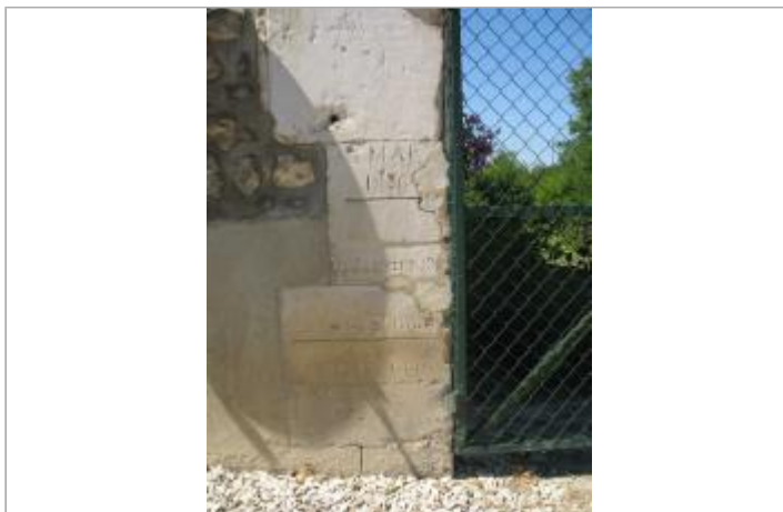
Maison éclusière de Preully