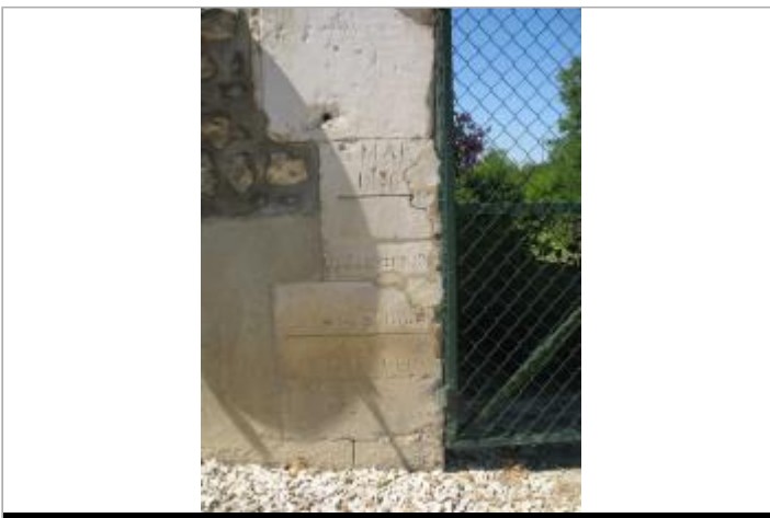
Maison éclusière de Preully - auteur photo : DIREN IDF

GÉOLOCALISATION Coordonnées WGS84 : X: 3.59349600 / Y: 47.78518300 Coordonnées RGF93 (Lambert 93) X: 744441.68 / Y: 6742921.34 Coordonnées RGF93 (ETRS89) : X: 3.593496 / Y: 47.785183 Code Hydro: F3--0200 Rive de référence: