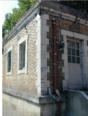
Bâtiment des sapeurs pompiers sur le berge