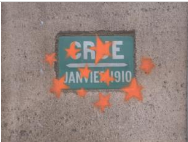
Repère de crue de 1910

Altitude calculée de l'eau (en m) : 34.25 m