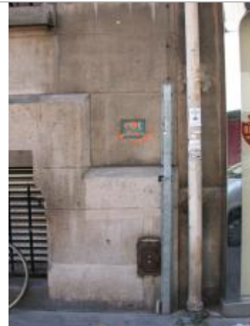
57 rue Traversière

Coordonnées WGS84 : X: 2.37425740 / Y: 48.84865530