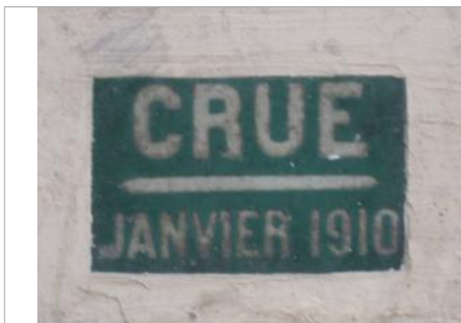
Repère de crue de 1910