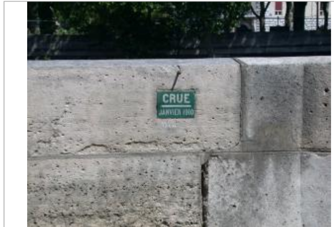
En face du 1 quai d'Anjou

Coordonnées WGS84 : X: 2.36012788 / Y: 48.85104050