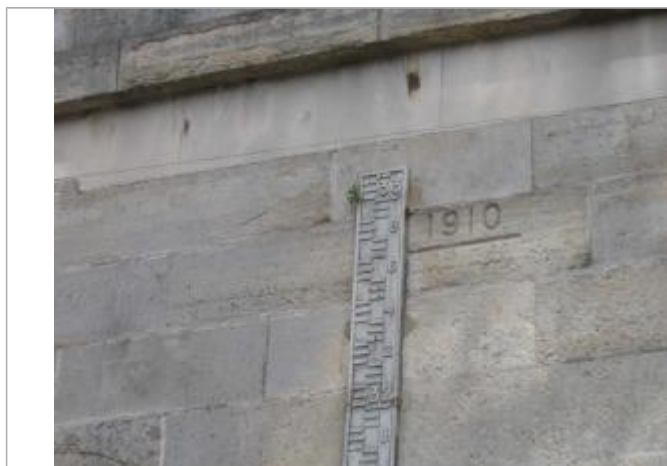
Repère de crue de 1910