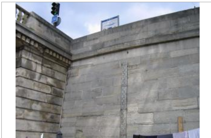
Pont des Invalides