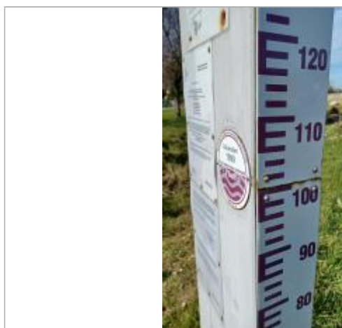
Macaron à 101 Cm/échelle limnimétrique.