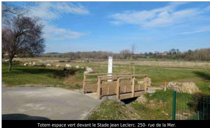
Totem espace vert devant le Stade Jean Leclerc. 250- rue de la Mer.