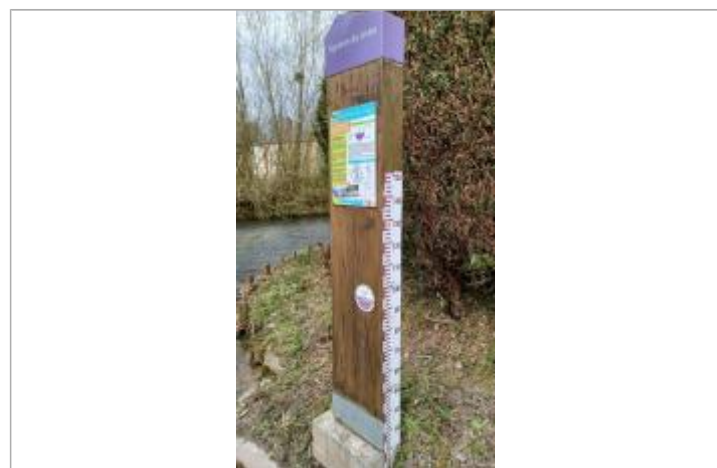
Cours d'eau : Saône. Macaron PHEC indiquant le niveau de la crue de décembre 1999 à 93 cm/ échelle limnimétrique.

GÉNÉRAL Code : DIREN_IDF_R_876_1328 Date de mise à jour : 14/03/2022 Auteur : SPC SMYL