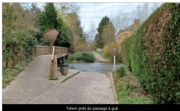
Totem près du passage à gué

GÉOLOCALISATION Coordonnées WGS84 : X: 0.93052200 / Y: 49.75414400 Coordonnées RGF93 (Lambert 93) X: 550788.57 / Y: 6963642.74 Coordonnées RGF93 (ETRS89) : X: 0.930522 / Y: 49.754144 Code Hydro: G4--0200 Rive de référence: Droite