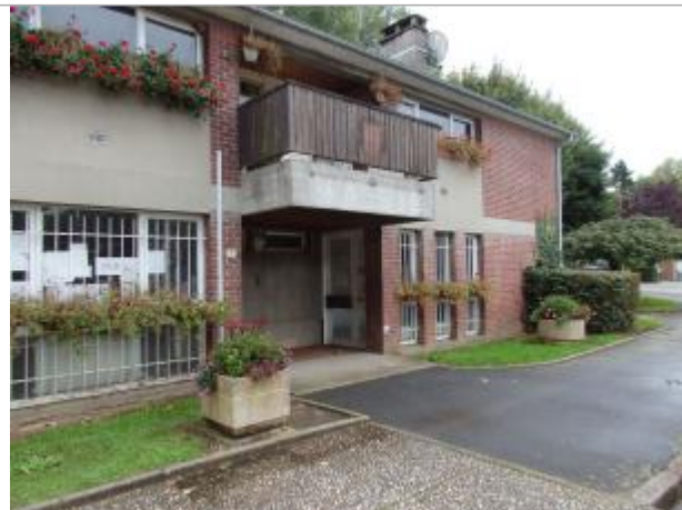
PHEC sur la façade de l'ancienne Mairie Val de Saône