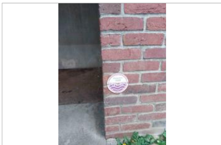
Vue sur le repère normalisé, sur le mur droit de l'ancienne entrée

Altitude calculée de l'eau (en m) : 89.3