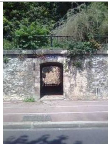
encadrement escalier C face au 168 av Leclerc St Maurice