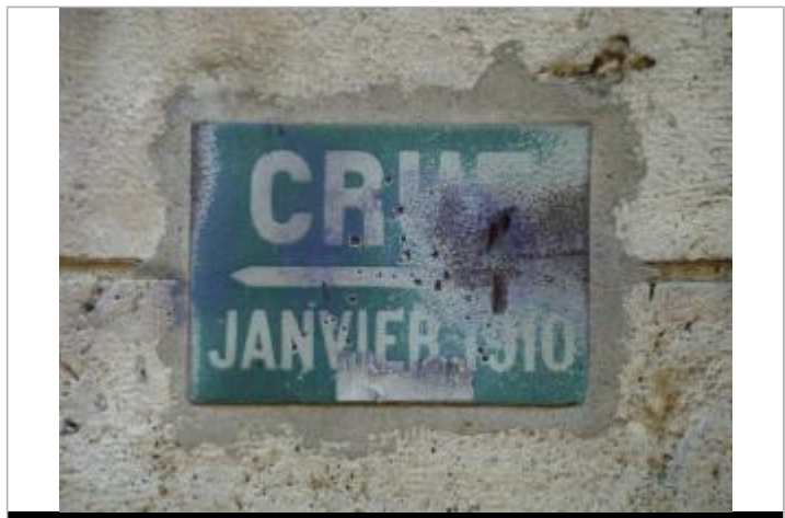
Repère de crue \"Crue janvier 1910\". 50, boulevard de Bercy. Paris, 12e.

GÉNÉRAL Code : DIREN_IDF_R_835_1270 Date de mise à jour : 31/05/2022 Auteur : SPC SMYL