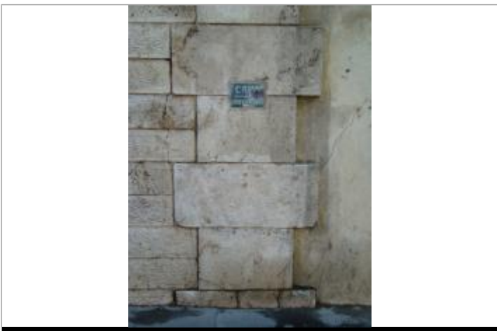
Repère de crue \"Crue janvier 1910\". 50, boulevard de Bercy. Paris, 12e.

GÉOLOCALISATION Coordonnées WGS84 : X: 2.38297900 / Y: 48.83982400 Coordonnées RGF93 (Lambert 93) X: 654712.74 / Y: 6860151.84 Coordonnées RGF93 (ETRS89) : X: 2.382979 / Y: 48.839824 Code Hydro: ----0010 Rive de référence: Droite