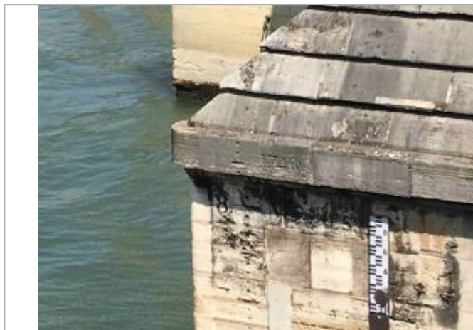
Vue du repère depuis le quai

Système altimétrique : NGF IGN 1969 (système normal)