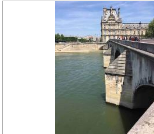
Vue depuis le quai