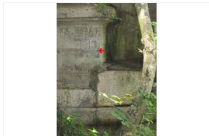
Crue de 1913 - auteur photo : LR de Blois