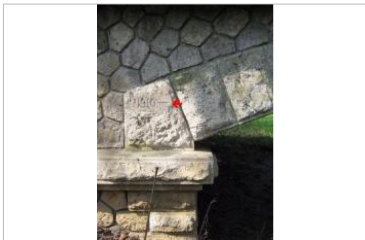
Repère de crue de 1910

Code : DIREN_IDF_R_632_936 Date de mise à jour : 31/07/2018 Auteur : SPC SMYL