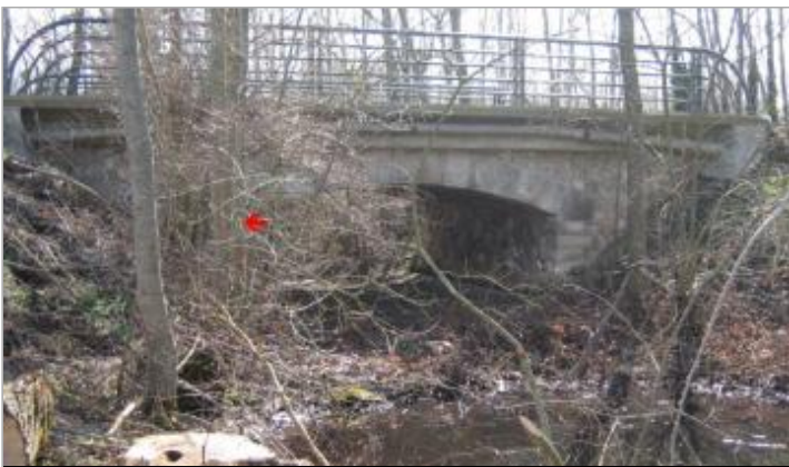
Ouvrage de décharge - auteur photo : LR de Blois

GÉOLOCALISATION Coordonnées WGS84 : X: 2.76942370 / Y: 47.96553850 Coordonnées RGF93 (Lambert 93) X: 682792.56 / Y: 6762819.42 Coordonnées RGF93 (ETRS89) : X: 2.7694237 / Y: 47.9655385 Code Hydro: F4--0200 Rive de référence: Non renseigné