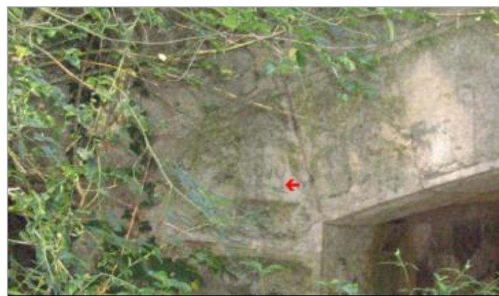
Culée du pont (ouvrage de décharge)