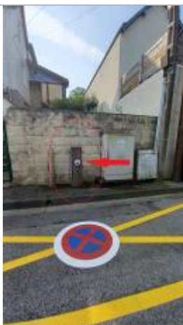
Laisse de crue à 62 cm/sol.

Altitude calculée de l'eau (en m) : 11.57