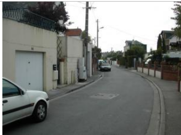
Macaron PHEC indiquant le niveau de la crue de la Lézarde du 1er Juin 2003 à Montivilliers .