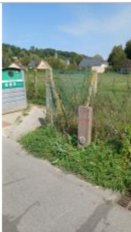
Laisse de crue à 36 cm/sol.

Altitude calculée de l'eau (en m) : 7.78