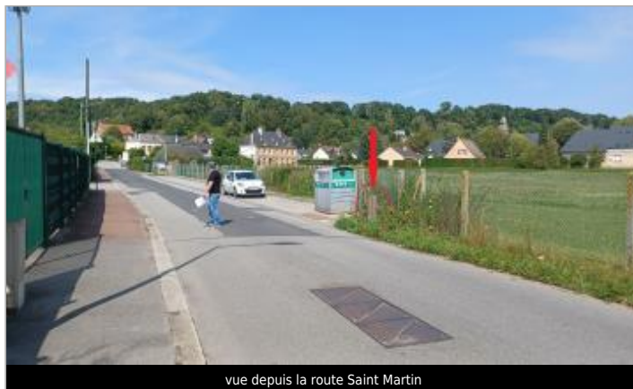
vue depuis la route Saint Martin