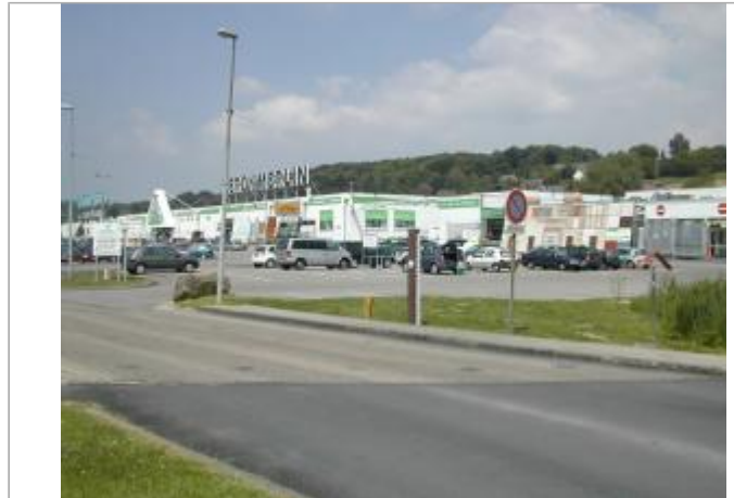
Macaron PHEC indiquant le niveau de la crue de la Lézarde du 1er Juin 2003 à Montivilliers .

Coordonnées WGS84 : X: 0.19051190 / Y: 49.52387820