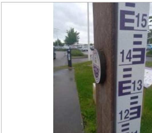
Vue sur le macaron, avec la référence hauteur à l'échelle