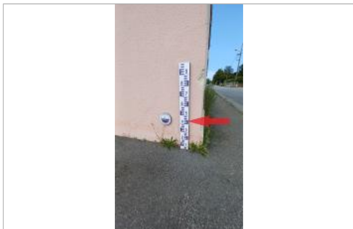
Laisse de crue à 44 cm/sol.