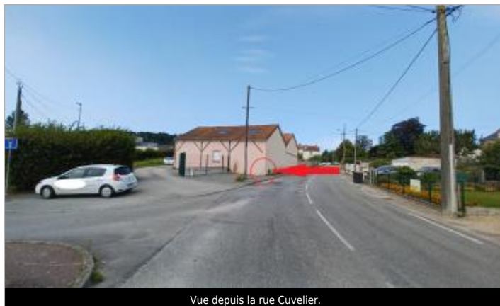
Vue depuis la rue Cuvelier.