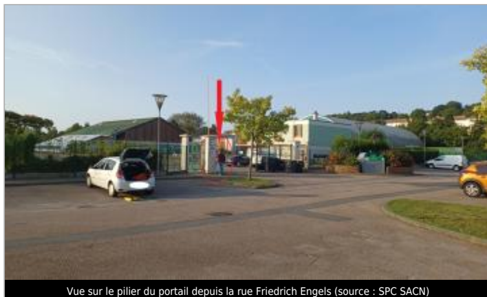
Vue sur le pilier du portail depuis la rue Friedrich Engels