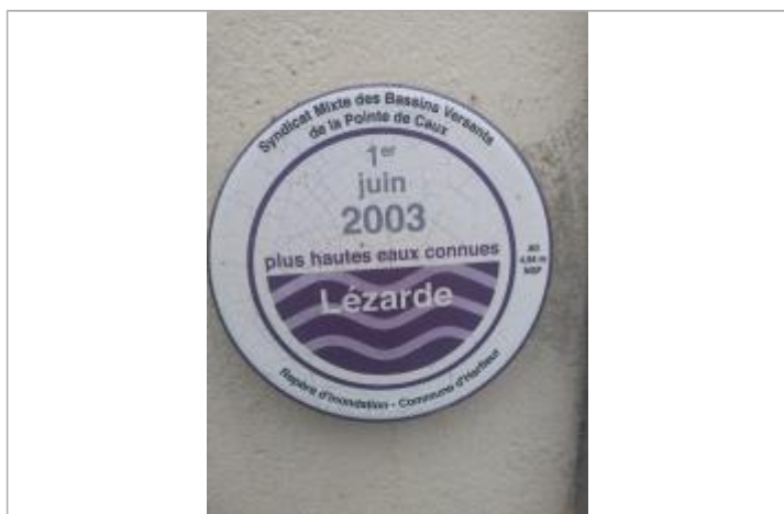
Zoom sur le macaron normalisé, avec la cote NGF référencé