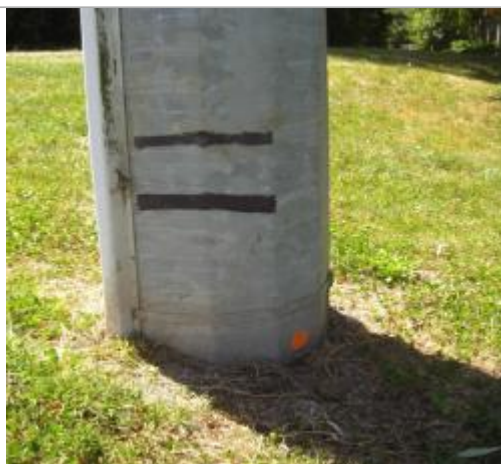
Repère de crue de 1993 et de ?