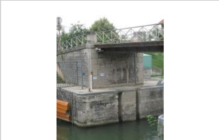
Plaques indiquant les niveaux des crues de la Marne de 1910 et 1955 à Vaires-sur-Marne .