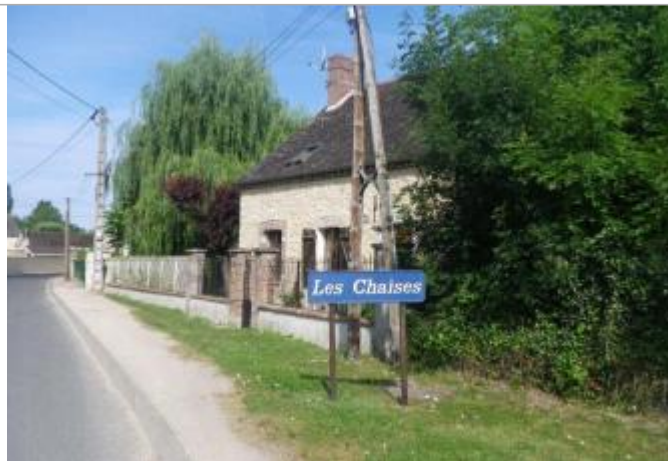
7 rue du Vieux Moulin

Coordonnées WGS84 : X: 3.35840000 / Y: 48.48309000