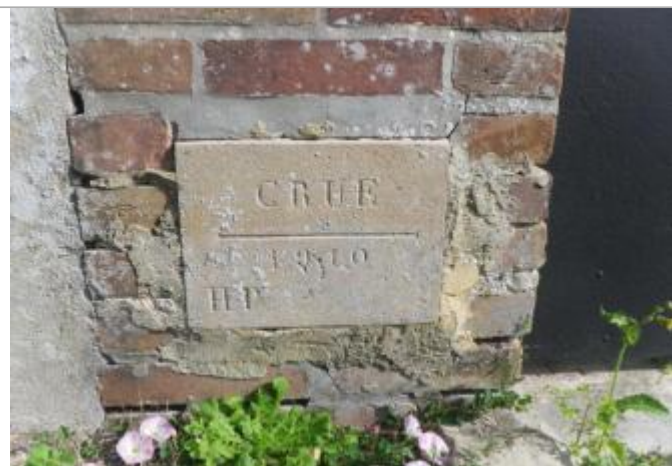
Repère de crue de 1910

Système altimétrique : NGF IGN 1969 (système normal)