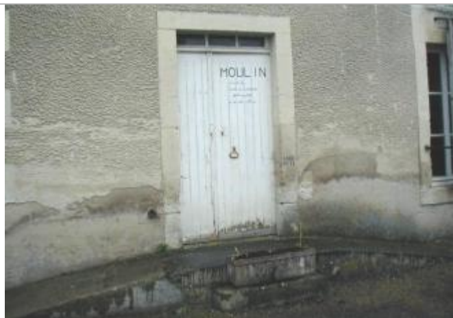
Niveau d'eau atteint le 27 avril 1998 (sommet de la dernière marche)

Altitude calculée de l'eau (en m) : 159.92