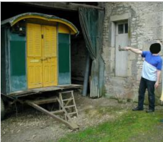
Niveau d'eau atteint le 27 avril 1998 (socle de la roulotte)

Altitude calculée de l'eau (en m) : 159.99