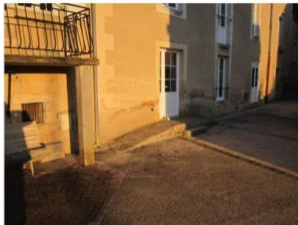
Capture Fiche IGN géodésie Z.B.03 - 164 (2014)

Coordonnées WGS84 : X: 4.11486270 / Y: 47.80126500