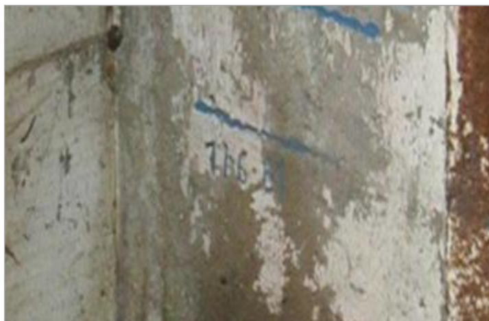
Repère de crue de 1981