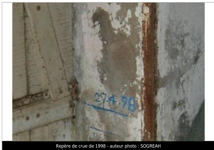
Repère de crue de 1998